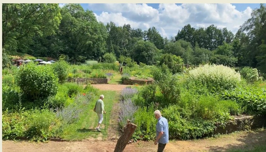
Overzicht vanaf het klim-klautertoestel over de Kruidenhof